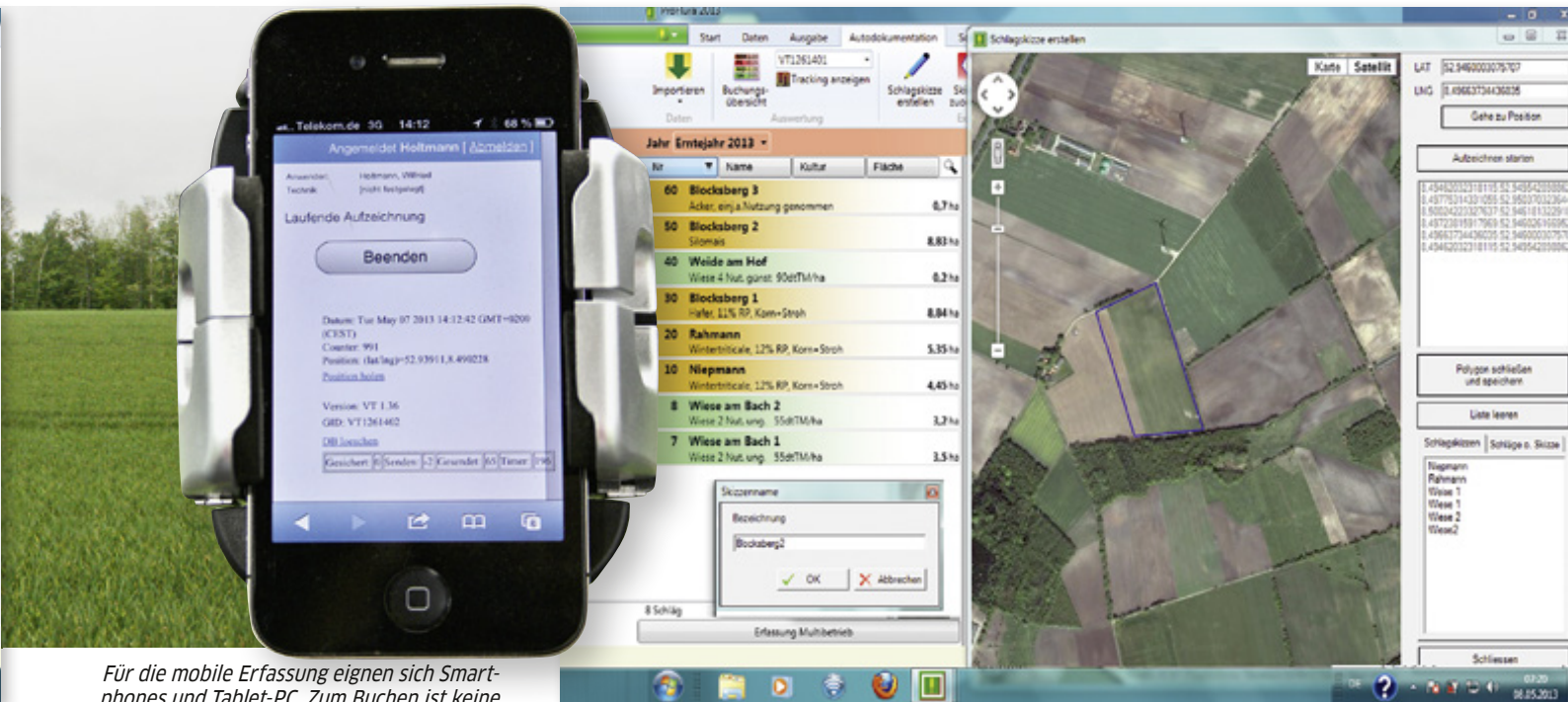
Für die mobile Erfassung eignen sich Smartphones und Tablet-PC. Zum Buchen ist keine App, aber eine Internetverbindung nötig. Hier der „Trackingstatus“ der Autodokumentation.

Sehr schön gelöst hat ASSW auch die Korrektur von Buchungen. Dabei können Sie Einzelschläge oder Sammelbuchungen nachbearbeiten. Ebenfalls ist es jederzeit möglich, in der normalen Schlagansicht einzelne Buchungen zu löschen. Alles in allem ist die